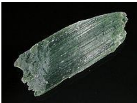
Rys. 3. Azbest chryzotylowy.