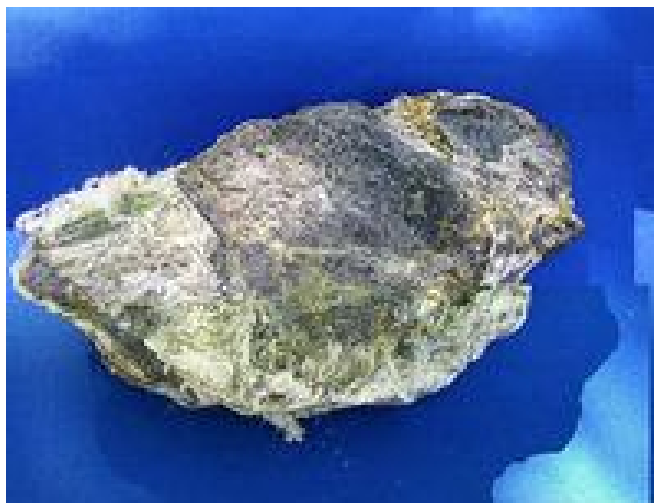
Rys. 2. Mineral krzemianowy.

W produkcji wykorzystywano głównie trzy rodzaje minerałów a są nimi: