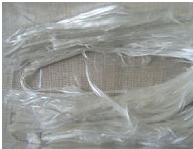
Rys.1. Włókna azbestowe

Azbest to grupa wielu różnych minerałów, występujących w formie włóknistej. Nazwa azbest nie określa konkretnego minerału, lecz dotyczy ogółu minerałów krzemianowych tworzących włókna. Należą do nich azbesty właściwe - azbesty serpentynowe (chryzotylowe) i amfibolowe (aktynolitowe, amiantowe, antofyllitowe, amozytowe, krokidolitowe – odmiana riebeckitu oraz magnesioriebeckitowe).